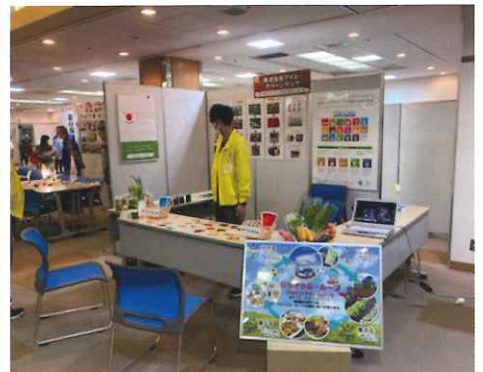
アイル・クリーンテック ブース