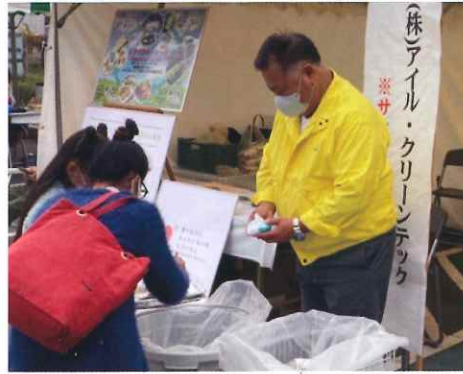
お声がける山口マネージャー