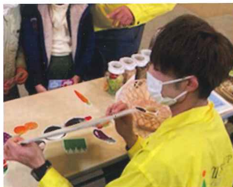
説明する簾藤社員