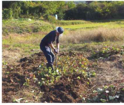
サツマイモ収穫中